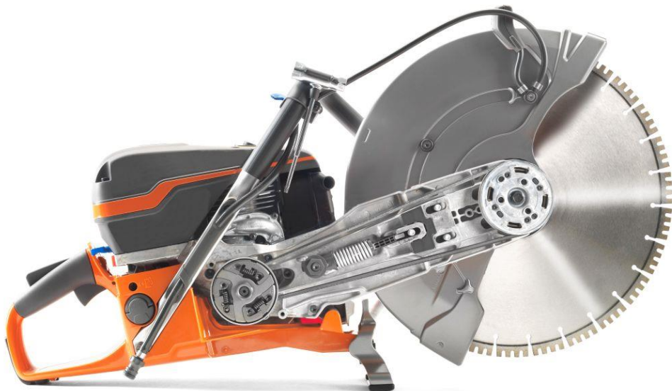
SmartTension - Activiert