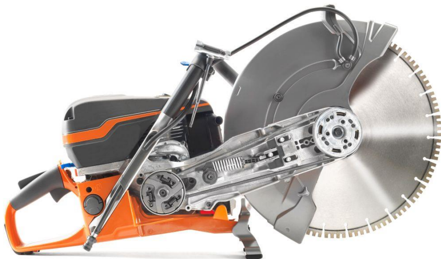
SmartTension - gelöst